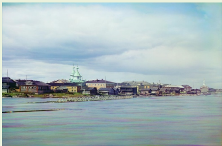
Село Сорока. Общий вид. 1916

В романе А. Линевского дается краткое, но довольно точное описание села Сороки, раскинувшегося по многим островам: «Широченное устье реки Выга отделяло старинное рыбацкое село от лесопильных заводов Беляевых. На скалистых островках левобережья серели домишки, между которыми вразброс, то там, то тут высились двухэтажные дома хозяев, обязательно в дощатой обшивке и покрашенные в голубую и желтую краску» 1