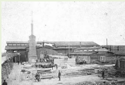
Завод "Финляндский"