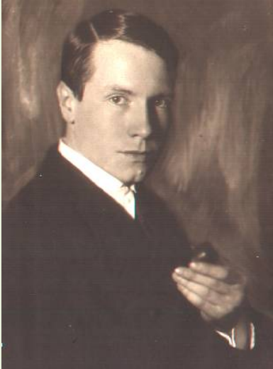
Подпись под фото: "Помню чем крепче нервы, тем ближе цель". 1930 г

Александр Михайлович Линеvский... Что сегодня школьники знают об этом уникальном человеке? После посещения занятий стало понятно, что совсем немного. На уроке литературы изучают его повесть «Листы каменной книги». Рассматривают ее как художественное произведение. Говорят о героях, обсуждают их поступки. Но не останавливаются подробно на биографии писателя, не знакомятся с другими его произведениями.