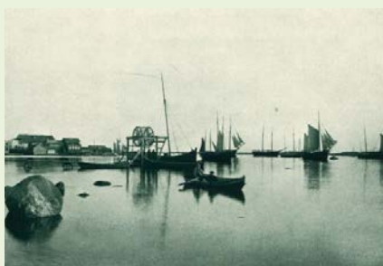
Село Сорока. Фото Я. И. Лейцингера. Из книги "Северный край. Иллюстри- рованный альбом Архангельской гу- бернии". 1914