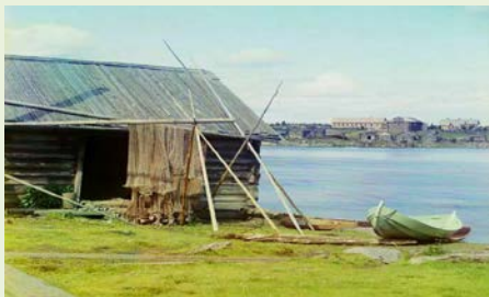
Фотограф С.М. Прокудин – Горский. Этюд сети. 1916