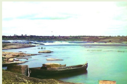
Вид на Угольный порог на реке Соро- ке. (Выг) 1916.