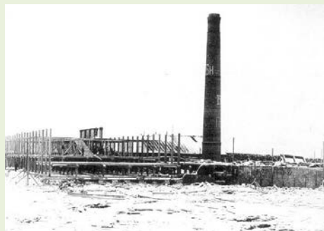
Завод «Феникс».